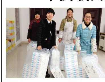
本报讯 “三八妇女节”来临之际,公司为全体女同事们发放福利。图为女员工们兴高采烈领取福利用品。