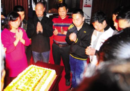
每月,晨龙公司都会为当月生日的员工举办集体生日聚会。图为大家在晨龙蛋糕房许愿。