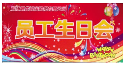
本报讯(通讯员 陈敏)为体现公司对员工的人性化管理和人文关怀,并以增进员工对公司的认同度和归属感,使广大员工真正体会到晨龙大家庭当中,进而保持更好的工作心态、与公司共同成长和发展,公司决定定期组织开展员工生日会活动。