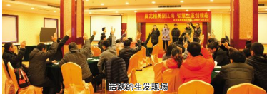
晨龙精英聚江南 智慧生发创精彩

12月21日清晨，晨龙集团共计37名员工迎着朝阳，坐上驶向安吉的客车，开始为期两天的安吉之旅。此次前去的是《晨龙报》通讯员及2012年度晨龙集团优秀员工。本次活动既是对优秀员工的鼓励，又增进了集团内成员间的沟通协作，更好地提升企业凝聚力。 安吉之行共计两天，37名员工分别来自集团下属伟龙铜业、安基橡塑、合一机械三个子公司。