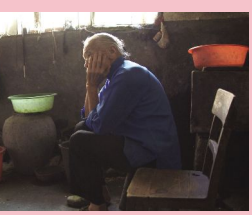
低矮潮湿的泥房是老奶奶生活的地方