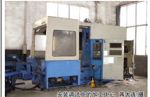
安装调试中的加工中心

本报(记者 朱助益)日前,公司花巨资购进两台大型加工中心,正开始安装调试,预计在二个月后投入生产。六工位加工中心是集镗、铣、攻等多种功能于一体的精加工设备,在产量、精度及柔性生产功能方面远胜于普通机床。6个工位配合,相对于普通工作台中加工同一件,更能节省更换工装的麻烦,从而进一步提高生产效率。