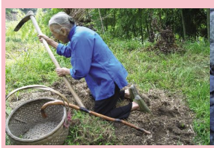
虽然眼睛看不见，老奶奶还是摸索着上山干农活