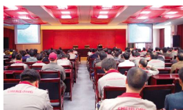
本报讯(记者 磊磊)4月1日,晨龙锯床股份有限公司召集全体员工,进行知识产权基础知识培训,旨在提高全体员工对于知识产权的认知。