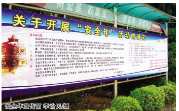
安全生产月宣传 争创佳绩

安全生产始终是企业生产经营过程中的头等大事,特别是生产繁忙时,安全生产更是重中之重。为高质量完成生产任务,有效预防安全事故的发生,从本年开始,安基橡塑多措并举抓安全,推出了开展“安全年”活动,主要内容是对员工是否发生安全事故的奖罚,公司在新工上岗前都进行了安全培训,内容为安全操作规程,主要让员工明白安全操作的章和制度,也就是什么能干什么不能干,为了时时刻刻提醒员工,公司在各个车间都安装了高音喇叭,同时在每一个发现员工违规操作的不规范行为。