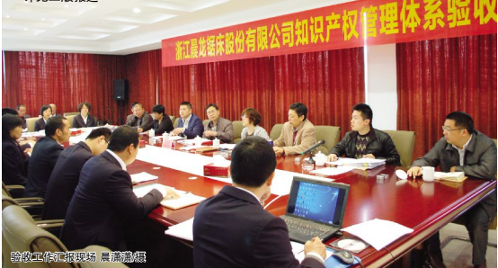
验收工作对接现场