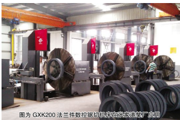
图为 GXK200 法兰件数控锯切机床在浙江晨龙锯床厂应用

本报讯(记者 晨满涛)日前,浙江晨龙锯床股份有限公司自主研发制造的 GXK200 法兰件数控锯切机床产品经浙江省经信委鉴定评审,被评为浙江省重点领域首台套产品。