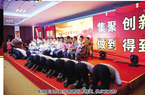
发政委委员鞠躬感谢销售精英、供应商支持