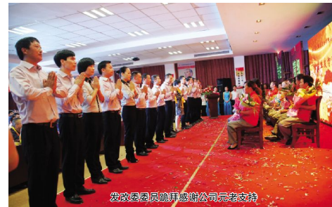
发政委委员鞠躬感谢公司元老支持