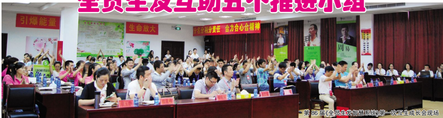
第86届《全员生发智慧系统》第一次互生长会场