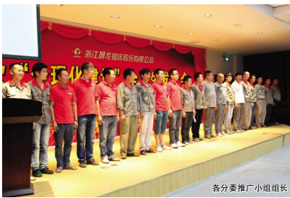
各分委推广小组组长