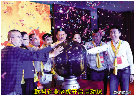
联盟企业老板开启启动球