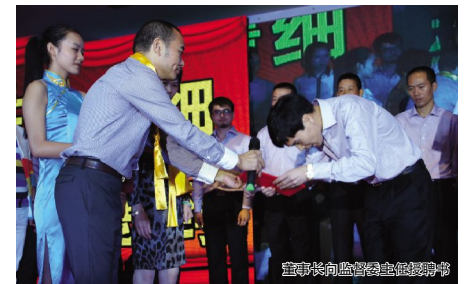
董事长向监事委员会主任授聘书