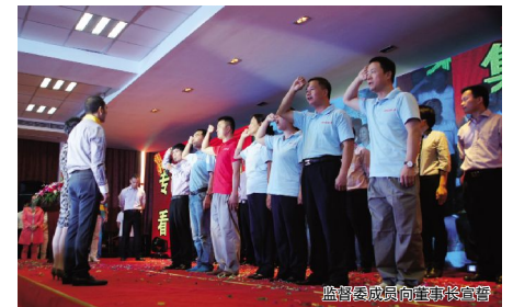
监事团成员向董事长宣誓