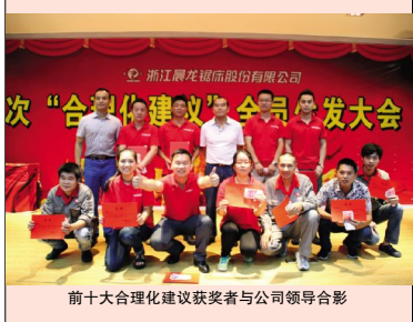
前十大合理化建议获奖者与公司领导合影