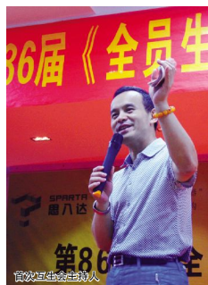
全员生发智慧系统

全员生发偏重的是解决问题思维模式的变革,而企业持续发展离不开实实在在的管理,关于全员生发和管理工具之间的关系,可以精彩地比喻“全员生发是运载火箭,各种管理工具有着各项功能卫星,只有靠全员生发这枚“火箭”,才能把“精益生产”、“工艺改革”、“薪酬与晋升”等卫星发射到准确的轨道自行运转。所以,随着这五个小组的有效推进,将会生发出更多相关的