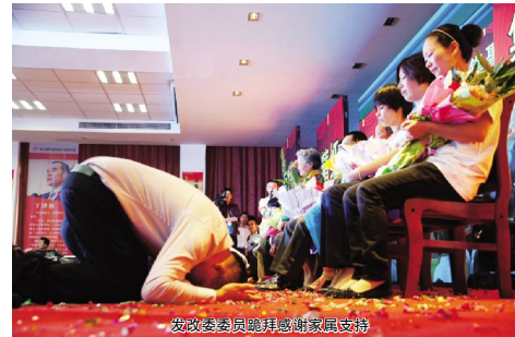
发政委委员鞠躬感谢家属支持